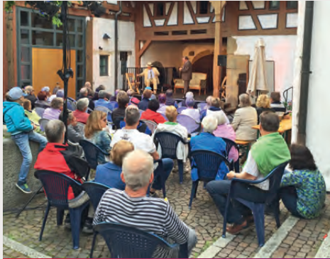
Soziales, Sport und Kultur