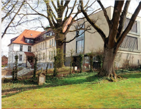
Schulen und Bildung