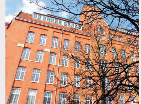
Wohnen und Arbeit

Kinder und Jugendliche sind unsere Zukunft. Sie sollen daher alle die gleichen Chancen auf gute Bildung erhalten. Dazu gehören für uns gebührenfreie Kindertageseinrichtungen. Damit entlasten wir die Familien und ermöglichen allen Kindern einen gelungenen Start. Denn Bildung beginnt nicht erst in der Schule.