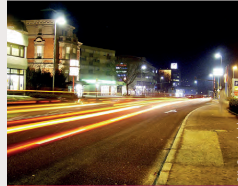
Umwelt und Mobilität